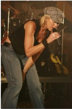
(Yreen, visita il suo sito www.yreen-music.com )