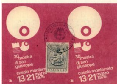
Cartolina pubblicitaria del 30° anniversario