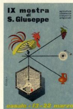
Cartolina pubblicitaria del 1954