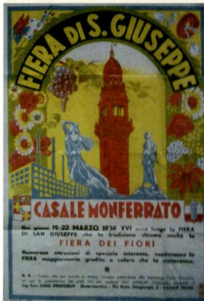
Manifesto originale dell'edizione 1938. La numerazione progressiva delle edizioni della Fiera fu introdotta solo dal 1946, al termine del secondo conflitto mondiale