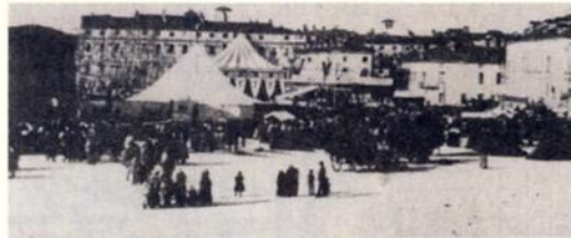
Vedute da Piazza Castello