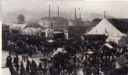
Immagini storiche della San Giuseppe scattate nel 1894 e 1895