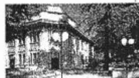
Le terme di Salice

ORE 9.30 Arrivo a SALICE TERME. Sosta Auto sul V.le Delle Terme Visita del luogo e aperitivo.